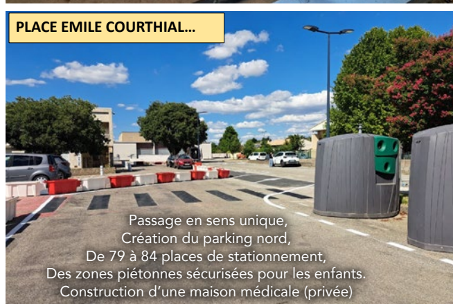
PLACE EMILE COURTHIAL...