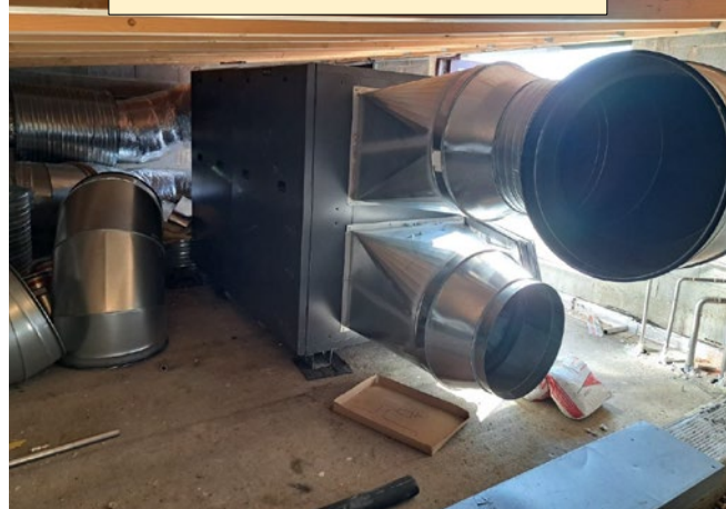
Centrale de traitement de l'air