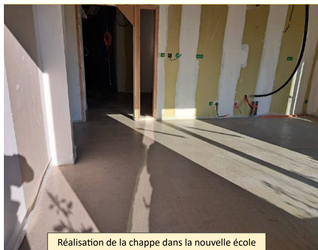
Réalisation de la chappe dans la nouvelle école maternelle.