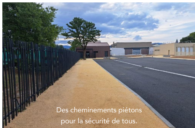
Des cheminements piétons pour la sécurité de tous.